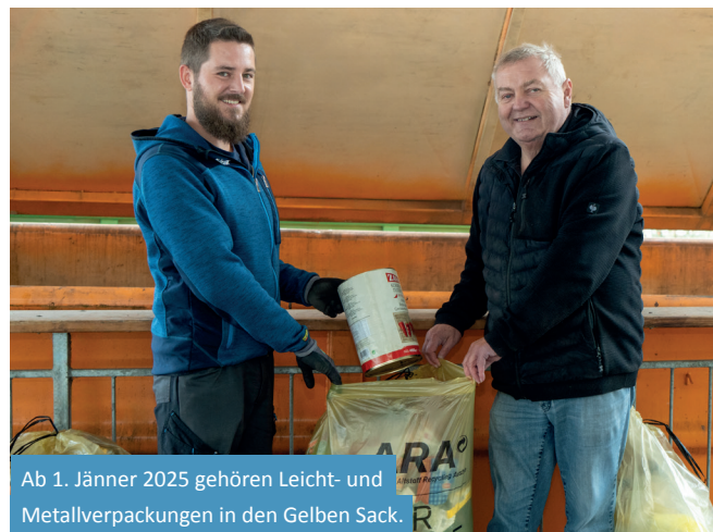
Ab 1. Jänner 2025 gehören Leicht- und Metallverpackungen in den Gelben Sack.

Die „neuen“ Gelben Säcke wurden bereits kostenlos an alle Kufsteiner Haushalte verteilt. Abgesehen von einem geänderten Aufdruck unterscheiden sich die Säcke nicht von den bisherigen. Diese können deshalb noch weiter verwendet werden.